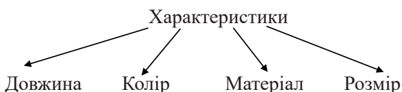
Рис. 2. Характеристики речей

Дескрипція – це процес зображення, специфікація будь-чого. Це надання визначення, презентації або пояснення речі, процесу чи явища. У письмовому дискурсі дескрипція є не тільки описом предметів одягу як таких, що включає надання найбільш важливих характеристик, а й складання психологічного портрету людини, яка обирає ту чи іншу деталь гардеробу. Відповідно до природи одягу, можна виділити найбільш важливі характеристики тієї чи іншої речі: довжина, колір, матеріал і розмір (рис. 2).