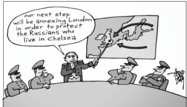
Рис. 11. Пример использования принципа «причина – следствие» в карикатуре

Принцип «причина – следствие»: образ реализует следствие того, о чем говорится “our next step will be annexing London in order to protect the Russians who live in Chelsea”. Между визуальным образом и высказыванием возникает причинно-следственная связь (Рис. 11).