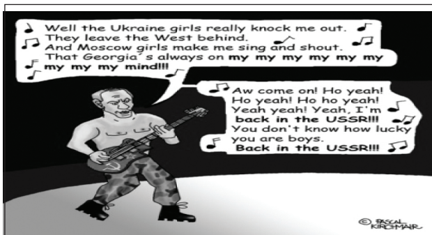
Рис. 4. Пример использования принципа аргументации в карикатуре (тактика перспективы)

Принцип аргументации также может задействовать тактику перспективы (Рис. 4): перспектива развития страны и общества, с точки зрения президента России, выражена в припеве песни: “Back in the USSR!!!” .