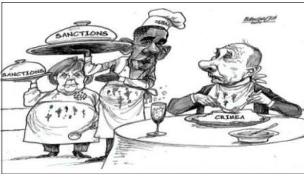
Рис. 8. Пример использования принципа «часть вместо целого» или синекдохи

Принцип персонификации: представление стран через образы президентов этих стран (Рис. 9). Играет один Путин, остальные президенты с удивлением и ужасом наблюдают за ним. В нормандском квартете явно отсутствует взаимодействие между музыкантами, что усиливает трагизм ситуации.