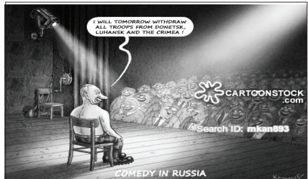
Рис. 5. Пример использования принципа дискредитации в карикатуре

высказыванию (Рис. 5). Президент России В. Путин заявляет: “I will tomorrow withdraw all troops from Donetsk, Luhansk and the Crimea!” Однако на карикатуре изображён актёр на сцене, показательной является также реакция зрителей – все они смеются. Окончательный этап воздействия – это надпись внизу: “Comedy in Russia” .