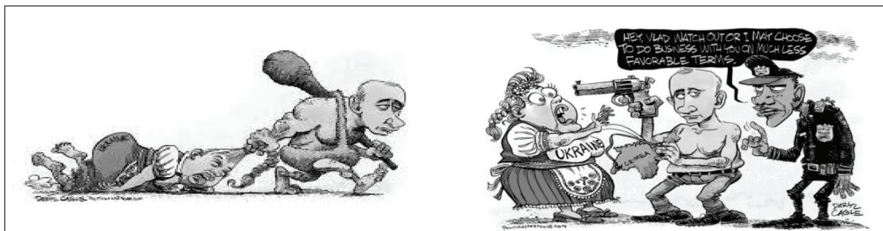
Рис. 1. Рис. 2. Реализация метафор «Государство – насильник», «Государство – жертва», «Государство – защитник» в карикатурах

Исследование современного политического дискурса в средствах массовой информации показывает, что для осмысления международных отношений используется приём персонификации, в частности задействована метафора «Государство – это индивидуум». Реализация осуществляется в виде метафор «Государство – насильник», «Государство – жертва» и «Государство – защитник» (Рис. 1, Рис. 2), данные метафоры часто используются, когда речь идёт о военном конфликте или военном вмешательстве во внутренние дела какого-либо государства [11].