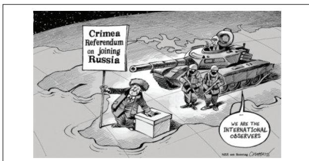
Рис. 10. Пример использования принципа определения значения в карикатуре

Принцип определения значения: текст только «намекает» на высказывание, которое становится очевидным благодаря визуальному образу (Рис. 10). На избирательном участке во время крымского референдума о присоединении к России: фраза “we are the international observers” подкрепляется образом российского танка, направленного на избирателя.