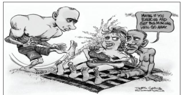
Рис. 12. Пример использования принципа дополнения в карикатуре

Принцип дополнения: текстовое высказывание дополняется с помощью визуального образа (Рис. 12). Визуальный образ добавляет собственное значение к общему высказыванию: “Maybe if you exercise and get big muscles, he’ll go away”.