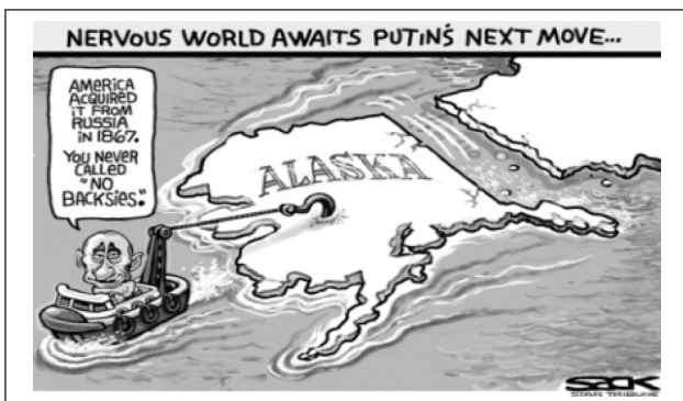
Рис. 15. Пример использования принципа усиления воздействия в карикатуре

Принцип усиления воздействия: Визуальный образ усиливает текстовое высказывание, вплоть до преувеличения (Рис. 15). Заголовок над карикатурой “Nervous world awaits Putin’s next move” подкрепляется недвусмысленными действиями – Аляска отбуксируется в сторону России.