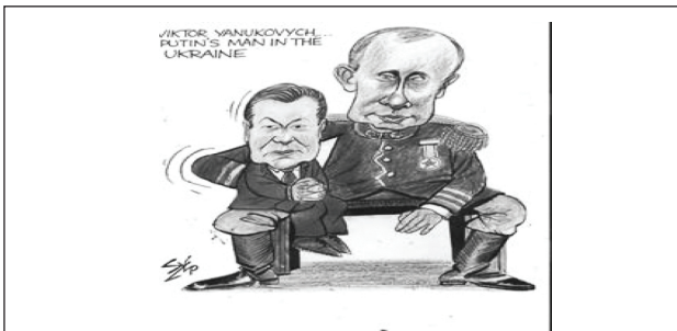
Рис. 3. Пример использования принципа аргументации в карикатуре (тактика иллюстрирования)

Принцип аргументации использует тактику обоснованных оценок и тактику иллюстрирования (Рис. 3), где образ выступает в качестве аргумента. В данном случае визуальная метафора демонстрирует истинность или адекватность высказывания. Изображение В. Януковича на руках у В. Путина подтверждает мысль о том, что бывший президент Украины являлся куклой-марионеткой в руках Путина, и демонстрирует истинность вербальной части карикатуры – “Viktor Yanukovich... Putin's man in Ukraine” .