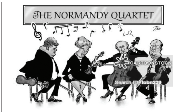
Рис. 9. Пример использования принципа персонификации в карикатуре

Принцип персонификации: представление стран через образы президентов этих стран (Рис. 9). Играет один Путин, остальные президенты с удивлением и ужасом наблюдают за ним. В нормандском квартете явно отсутствует взаимодействие между музыкантами, что усиливает трагизм ситуации.