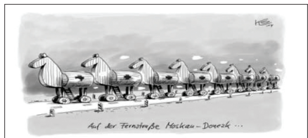
Рис. 13. Пример использования принципа связывания в карикатуре

Принцип связывания: целевой объект взаимно связан с другим объектом с помощью изобразительной подачи (вереница троянских коней – гуманитарная помощь из России). Создан контекст “Auf der Fernstraße Moskau-Donetsk”, в котором происходит ассимиляция элементов изображения (Рис. 13).