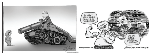
Рис. 6. Рис. 7. Пример использования принципа смысловой связи

Принцип задействования смысловой связи: используются определённые семантические связи между элементами визуального образа. Эти ассоциации возникают благодаря экстра-лингвистическому знанию и активируются с помощью образа. Рисунок 6 и изображает Германию (в образе Ангелы Меркель) в весьма двойственном положении – с одной стороны она всеми силами пытается преградить дорогу танку Путина, а с другой стороны – находится в зависимости от российского газа: дуло танка изображено в виде газовой трубы с вентилем, который Путин демонстративно перекрывает. На Рис. 7 мысли президента России “Should I flex more muscle on Ukraine?” и “Let me check with my personal trainer” сопровождаются мысленным образом так называемого «персонального тренера», в котором без труда угадывается фигура Сталина.